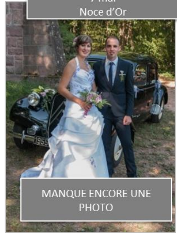
MANQUE ENCORE UNE PHOTO